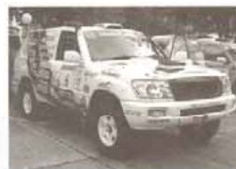
アジアクロスカントリーラリー参戦車。8月6～12日の7日間、山梨県青森市ジャンプルノーでアジアラリー隊にのりこめ競走しました。

通称「パリダカ」ラリー。1978年の開始以来、世界中で最も過酷なラリーとして有名。ヨーロッパからアフリカに渡り、砂漠をメインコースとして走るレーススポーツ競技。プロ・アマチュアを問わず、さまざまな車で参加できる。2009年の6ユーロミルホーが冠スポンサーを付ける。