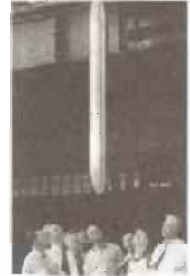
『THE TIME CAPSULE』口絵より タイムカプセルを見上げる人々

同じような試みが大阪で1970年(昭和45年)に開催された万国博覧会でも行われた。松下電器産業が主体となり、5000年先を目指して球形のタイムカプセルを大阪城公園に設置した。こちらでも紙と印刷方法を慎重に検討したうえで日本語版と英語版の記録書が作られ、日本中と世界中の図書館などに送られた。そして、そのうちの一つは大阪産業大学の総合図書館に所蔵されている。大阪産業大学の図書館も5000年後を目指して本を収蔵し公開している「図書館」の一つなのである。そんなことを考えていると総合図書館の無愛想なたたずまいが崇高な信頼性の象徴のように感じられるから不思議である。