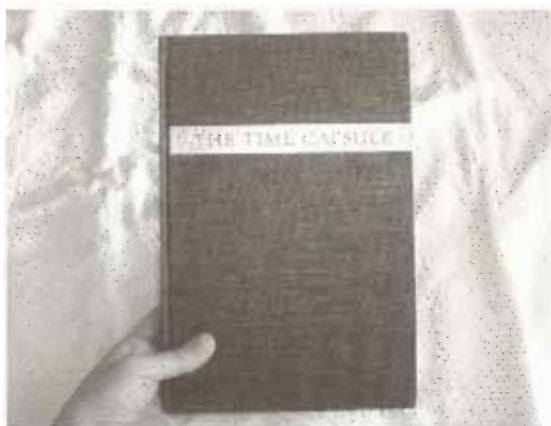
『THE TIME CAPSULE』表紙

もちろん現在の文明がほろびてしまい、このタイムカプセルも忘れられてしまい、遠い将来のある時、遺跡として発掘されることになるかもしれない。しかし、もし記録が残せるとすれば図書館だということで、特別な紙と印刷でこの青い本が176冊製作され、世界中の図書館など(博物館やチベットの僧院なども含む)に配られた。日本の国立国会図書館にも所蔵されている。5000年残るかどうかは誰にも判らないが、図書館というのは5000年残すぞという意気込みで本を収蔵している組織であり施設なのである。