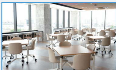
コモンズ(地域コミュニティ)