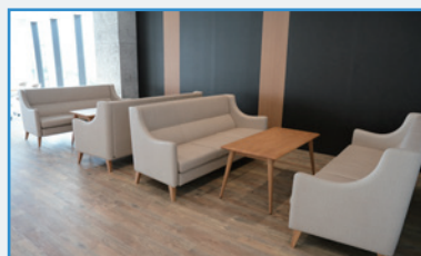
コモンズ(地域コミュニティ)