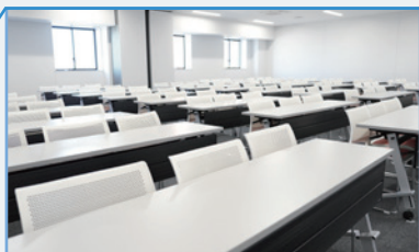
ミーティングルーム1