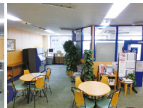
ラウンジ (約144平方メートル) ・テーブル個数: 4個・椅子個数: 20脚 ・50インチ液晶テレビ・DVDプレイヤー